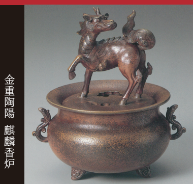
金重陶陽 麒麟香炉