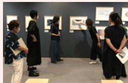
アートdeトークの様子